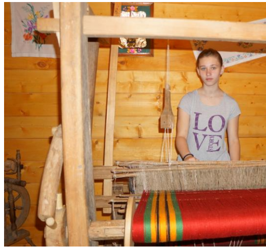
Музей народного быта и старых технологий