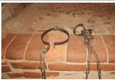
В тюрьме Мирского замка