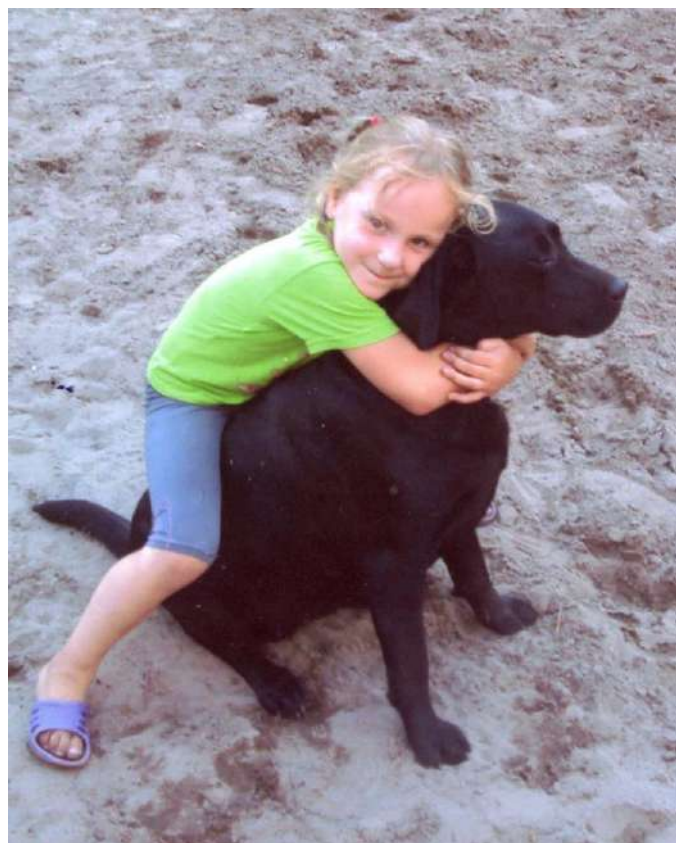
На фото собака Скалли Деевой В.