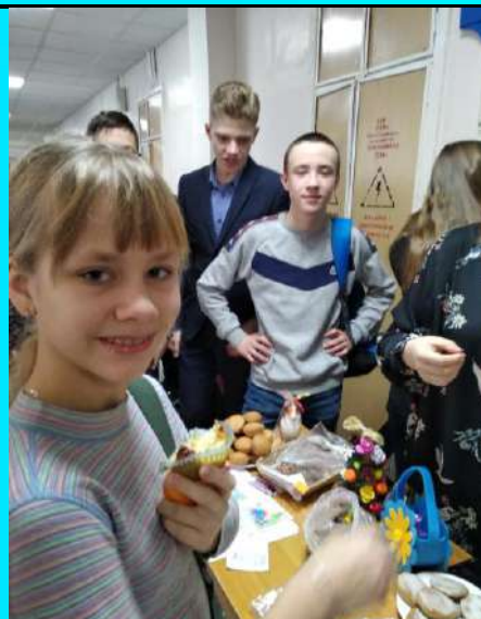
Фоторепортаж - «Новогодняя ярмарка»!