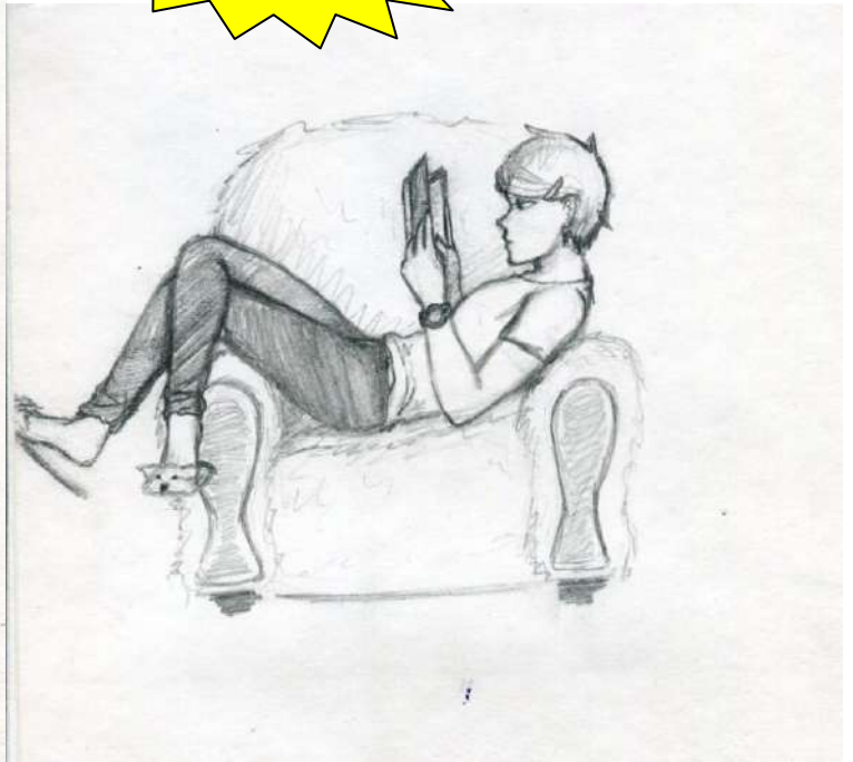
Рисунок 1 Портрет одноклассницы