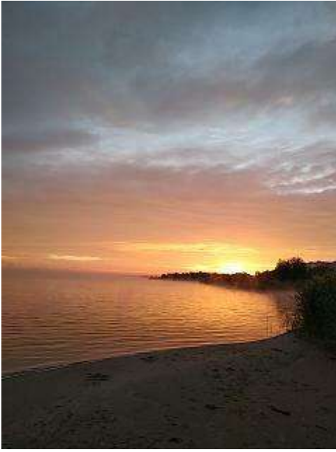
Фото Курчатовского водохранилища