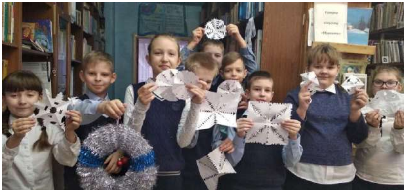
Ученики 4Б класса сделали снежинки к празднику!

Много ждем мы волшебства от него, конечно!