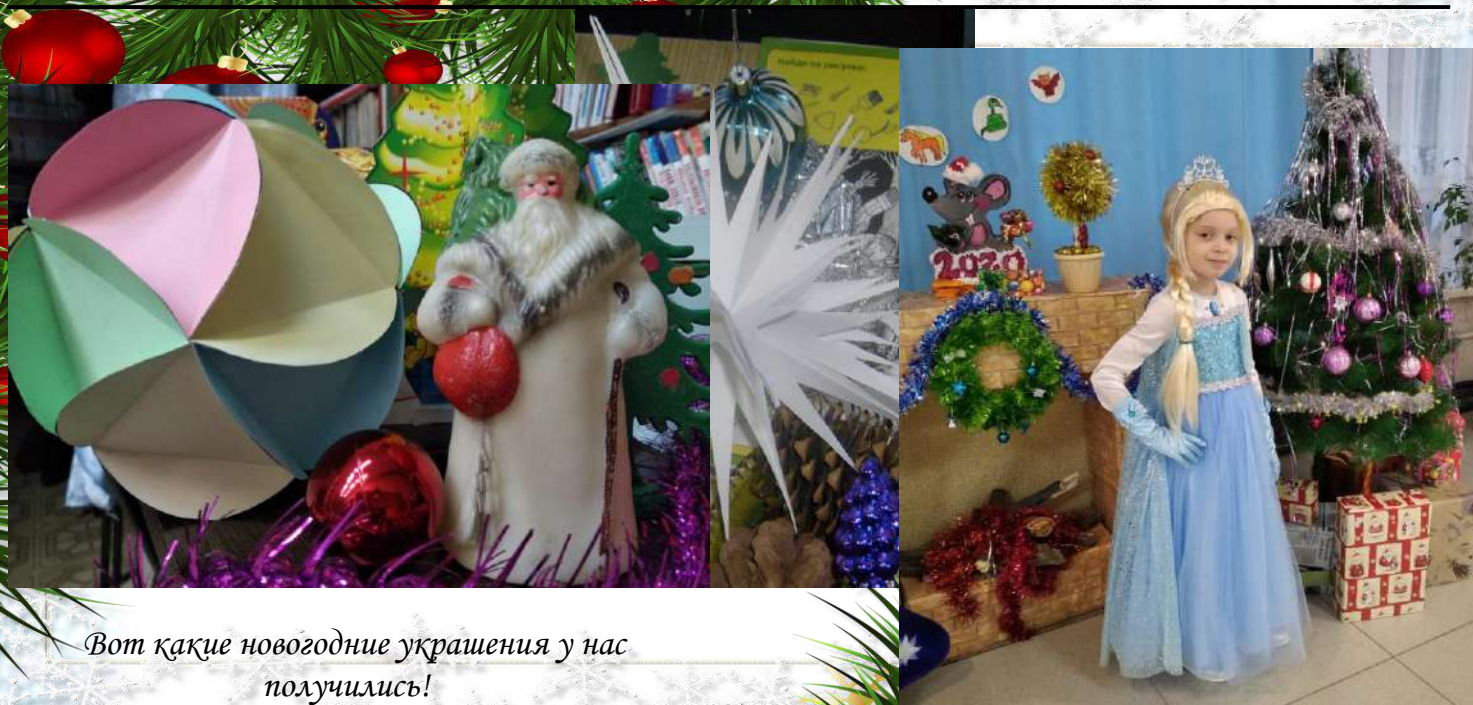
Вот какие новогодние украшения у нас получились!