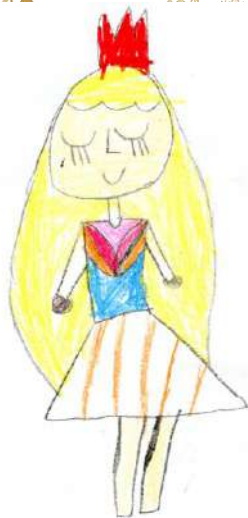
Скопова Лана 18 Принцесса