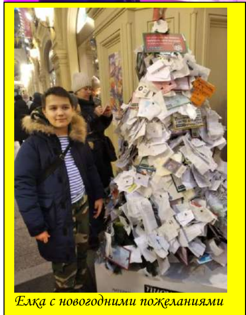
Елка с новогодними пожеланиями