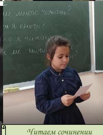
Читаем сочинения о книге