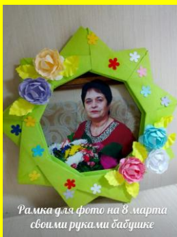
Рамка для фото на 8 марта своими руками бабушке

Цветы можно делать из любой бумаги — старой газеты, газеты с иероглифами, цветных или черно-белых журнальных страниц, разнообразной оберточной бумаги, фантиков от конфет, кальки, нотных листов и из школьной тетради.