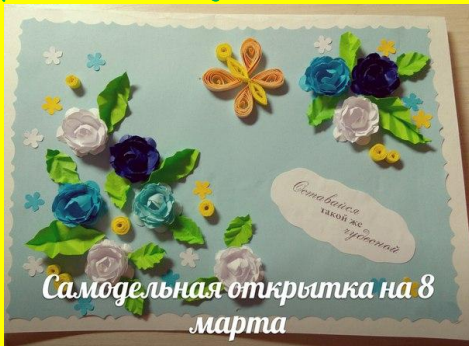
Самоделка открытка на 8 марта

Урок рукоделия от Богдановой Марии. Маша предоставила нам свои поделки, выполненные на занятиях у Литвиновой А.П. Это открытки и рамки для фотографий, украшенные бумажными цветами и бабочками!