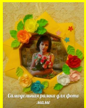
Самоделка рамка для фото маме