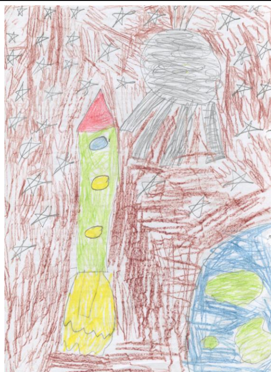
Рисунок 2 Селиванов И. "Ракета"