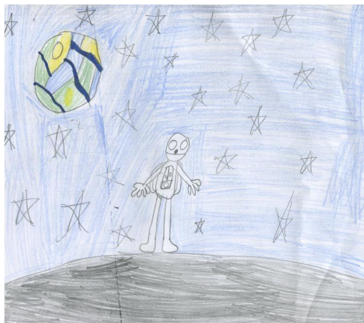
Рисунок 4 "Космос" Гридина В.