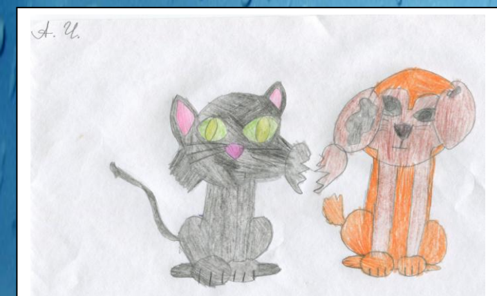
Рисунок 5. "Друзья" Чньюкина А.