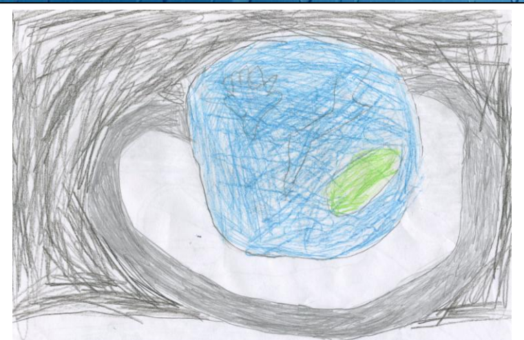
Рисунок 3 «Планета Сатурн» Боджолян С.