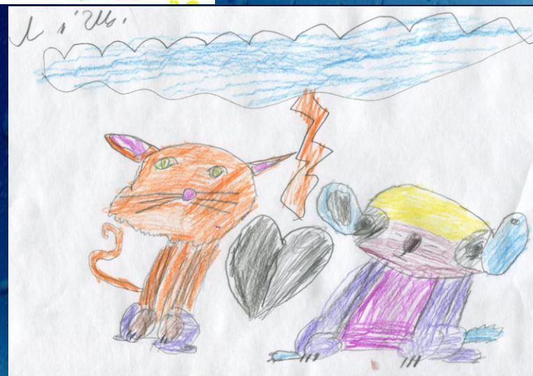
Рисунок 1 "Друзья. Белка и Стрелка" Щербова Е.