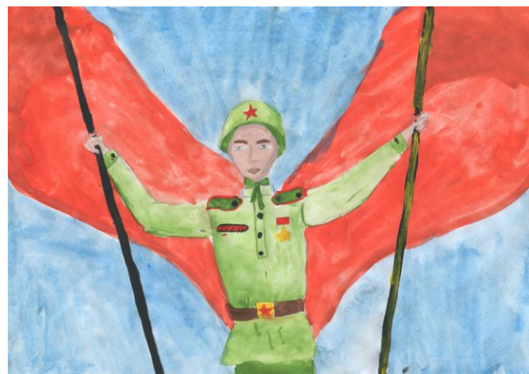
Рисунок 4 Ефремова Я.