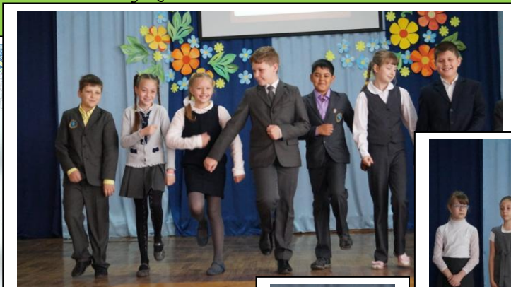
На фото- День пионерии у 3-х классов