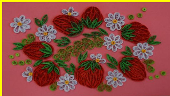
Квиллинг. Работа Богдановой М.

Квиллинг (англ. quilling — от слова quill «птичье перо»), также известен как бумагокручение — искусство изготовления плоских или объёмных композиций из скрученных в спиральки длинных и узких полосок бумаги. Такую замечательную технику освоили на занятиях Литвиновой А.П. наши гимназисты.