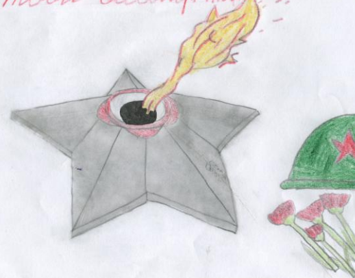
Рисунок 2 Плохих В.

Имя твоё неизвестно подвиг твой бессмертен!!!