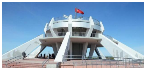
Рисунок 1. Тепловские высоты