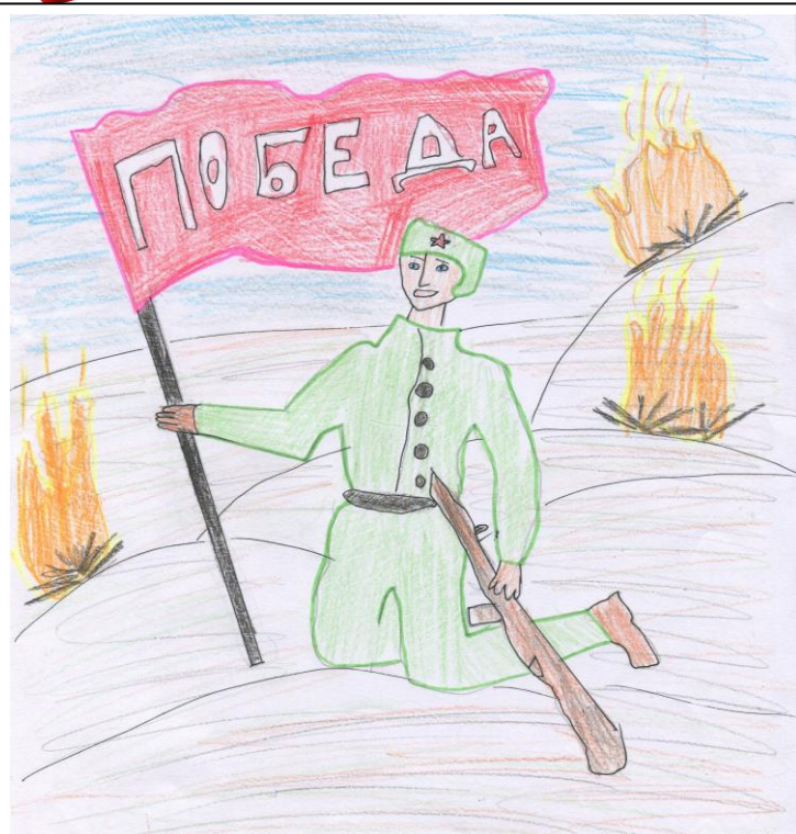
Рисунок 1 Богданова М.

Имя твоё неизвестно подвиг твой бессмертен!!!